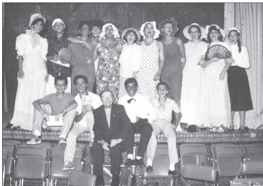
Actores de la Parroquia tras una representación, 1986.