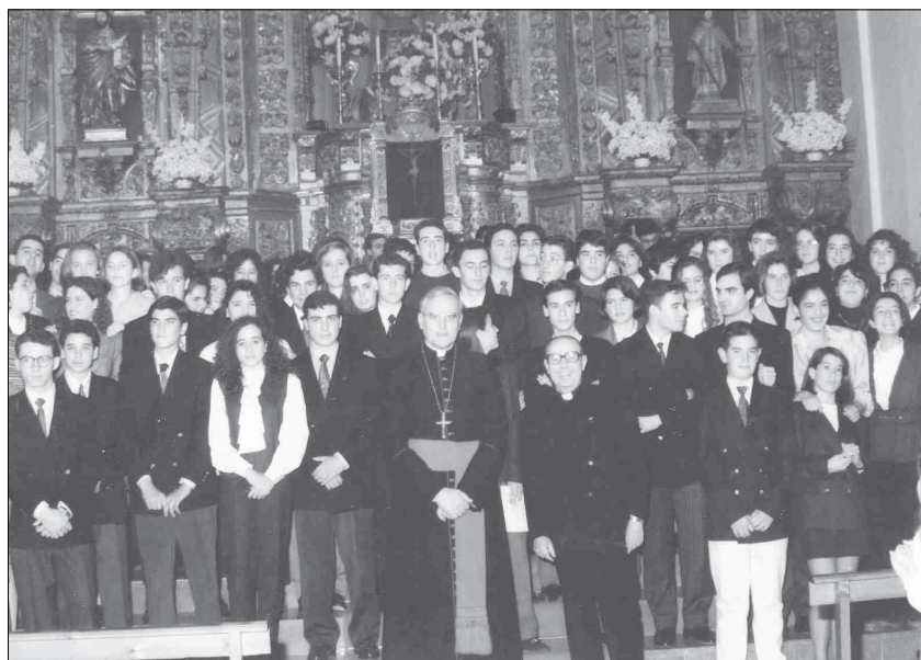
Los recién confirmados posan junto al Cardenal Carlos Amigo, 1992.

fe cristiana entre los que destaca la dignidad incomparable del hombre con respecto a todas las demás criaturas.